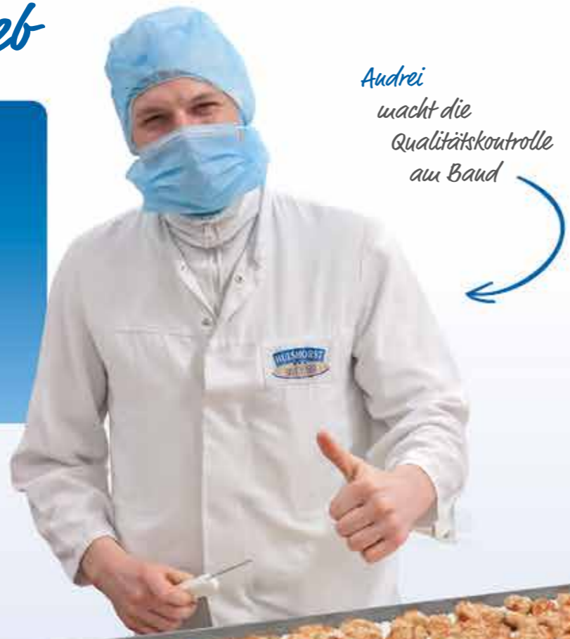
Audrei wacht die Qualitätskontrolle am Band